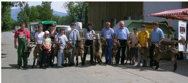
Les plus belles chèvres bottées et ses éleveurs se présentent pour la photo de la presse.