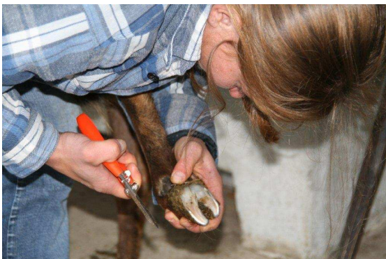
Des ongles bien coupés

Ce fut une journée instructive et passionnante en compagnie d'autres amis de chèvres, qui nous a beaucoup apporté en tant qu'hôtes. Nous remercions nos chèvres pour leur comportement exemplaire, il nous a semblé qu'elles étaient fières d'aller au pré depuis ce jour.