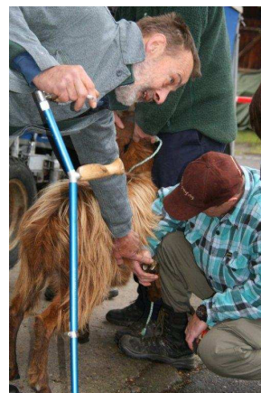
Jost au commentaire